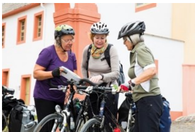
Mit Freundinnen auf Landpartie-Tour