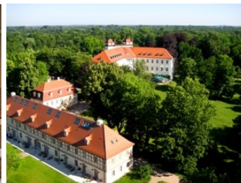
Spa-Stopp im Schloss Lübbenau im Spreewald